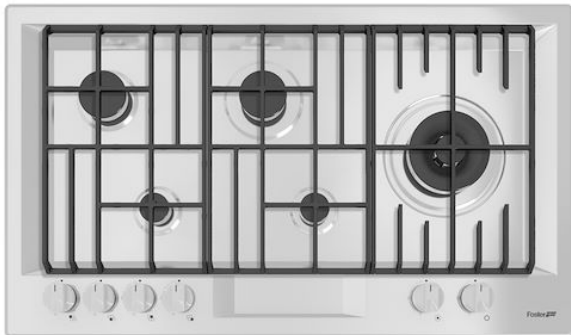
Table de cuisson FL