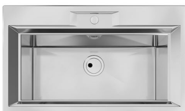
Évier FL 2975 060